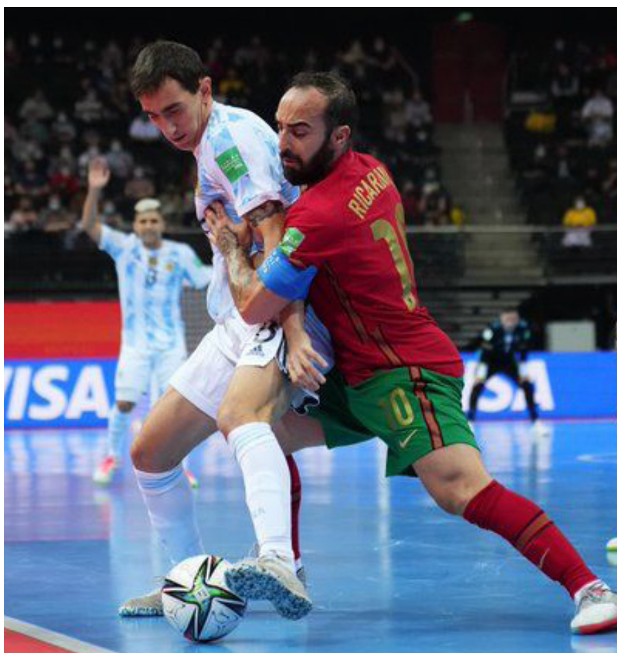
Final cerrada frente a Portugal, con poca fortuna pero con mucho coraje: Argentina subcampeona mundial de futsal.