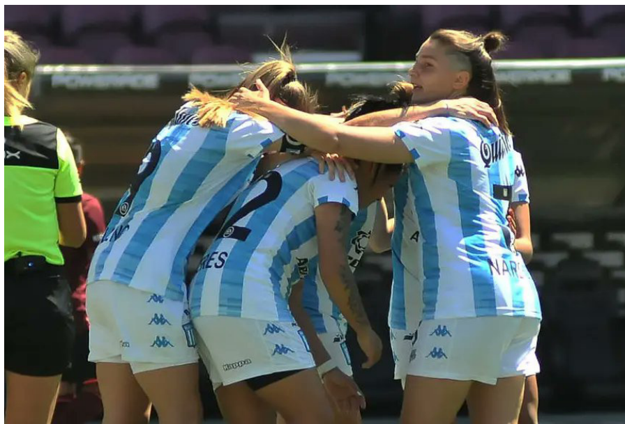
El festejo de las de Avellaneda.