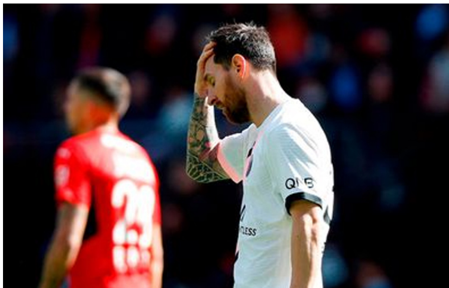
Messi tuvo poca influencia en el rendimiento del PSG.

El defensor Lucas Martínez Quarta convirtió el gol de Fiorentina en la derrota por 2-1 contra el Napoli, en una nueva fecha del Calcio italiano; Nicolás Gonzalez, en cambio, alternó buenas y malas. Nicolás Domínguez fue titular en la victoria por 3-0 del Bologna frente a Lazio, al igual que