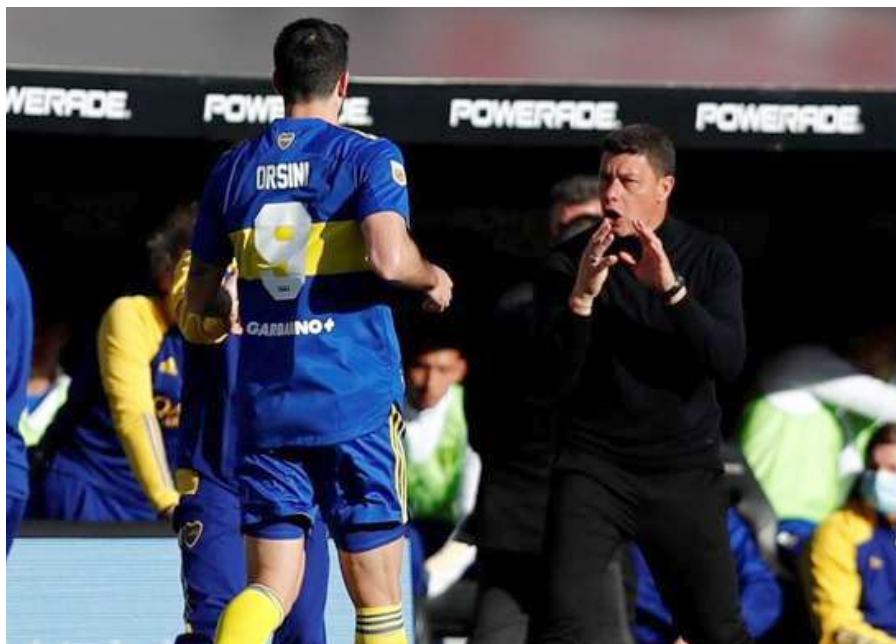
Battaglia ordena, con un jugador menos solo atinó a mantener un plan defensivo.

Una vez finalizado el encuentro, el DT de Boca explicó la salida de Cardona en el primer tiempo: “Se dio porque había que tener un poco más de control, ocupar el