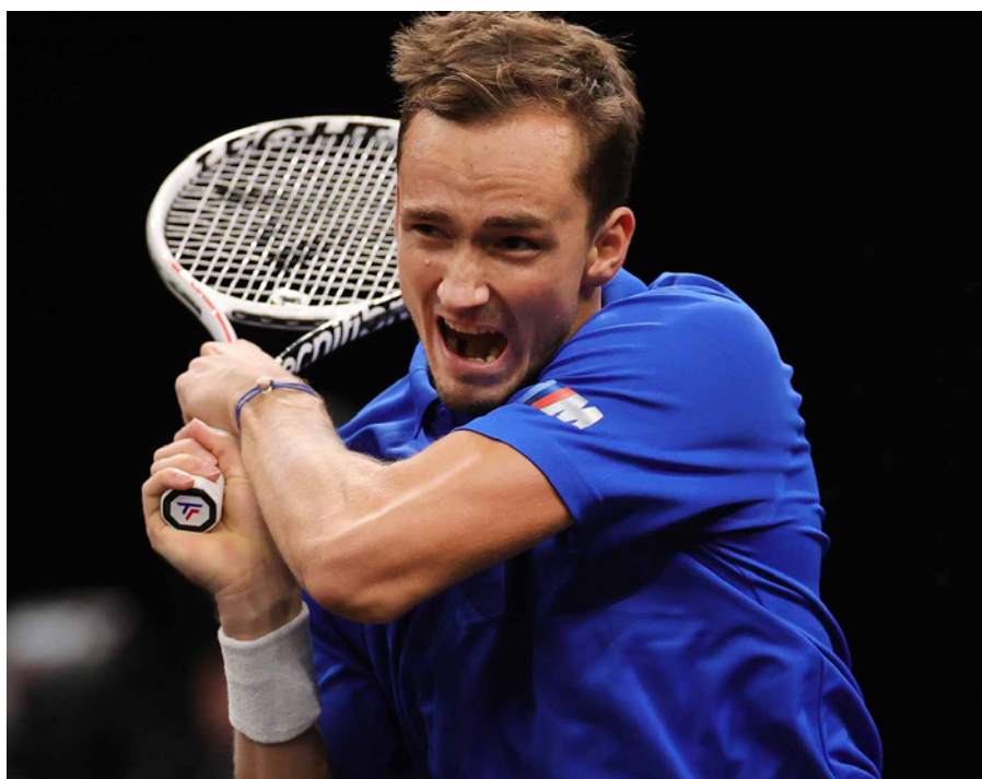
El ruso Medvedev será uno de los más "veteranos" a sus 25 años