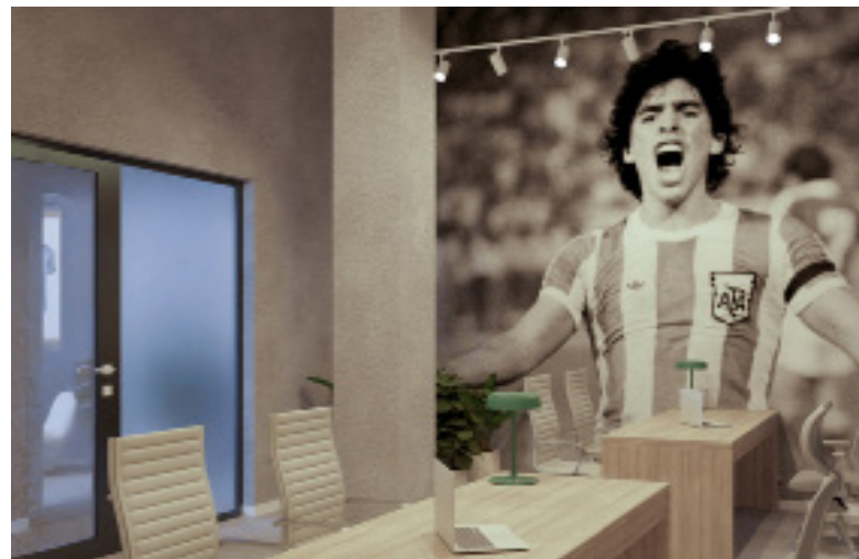
Ubicado en North Bay Village, Florida. Fue presentado el 13 de junio de 2024

La llegada de Lionel Messi al Inter Miami intensificó la consolidación de la AFA en ese territorio. Ubicado en North Bay Village, Florida, se encuentra el centro deportivo y recreativo comunitario, presentado el 13 de junio de 2024, en un predio que pertenece al Treasure Island Elementary School, la escuela primaria y secundaria pública de la ciudad.