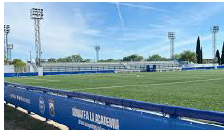
El proyecto se había presentado en 2018, se concretó en abril de este año.

Actualmente funciona con cientos de niños y niñas que entrenan a diario con la metodología del fútbol argentino. Además, como informaron desde prensa de la organización del fútbol argentino, ofrece clínicas de fútbol, campus, capacitaciones para entrenadores y actividades de formación.