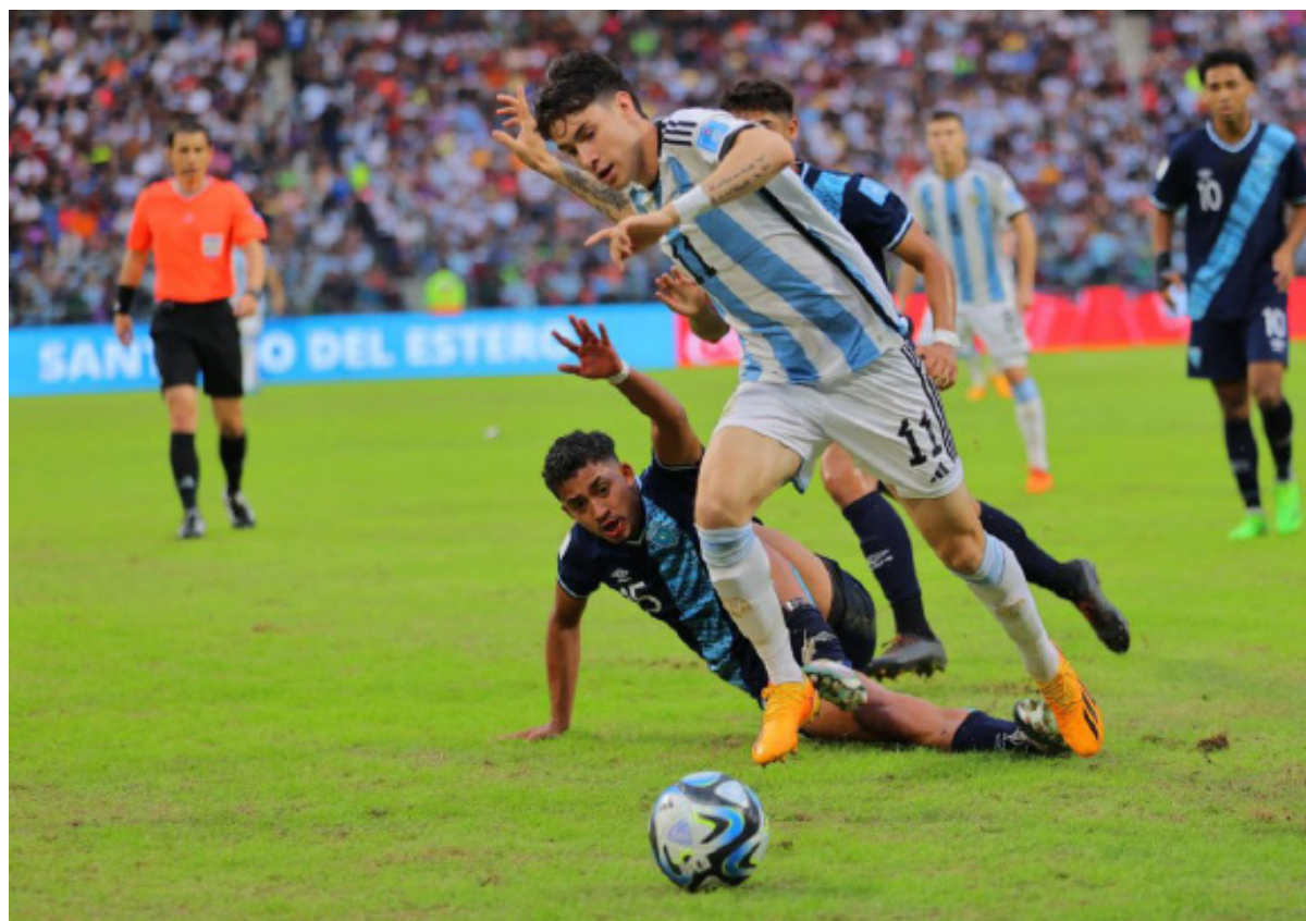
Se fue de Vélez a los 16 años, directo a Juventus. En la actualidad juega para Roma.