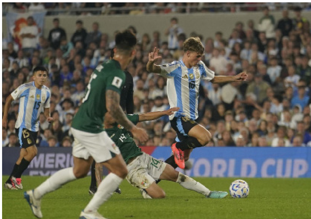
Hizo su presentación en la goleada 6 a 0 frente a Bolivia en el Monumental.